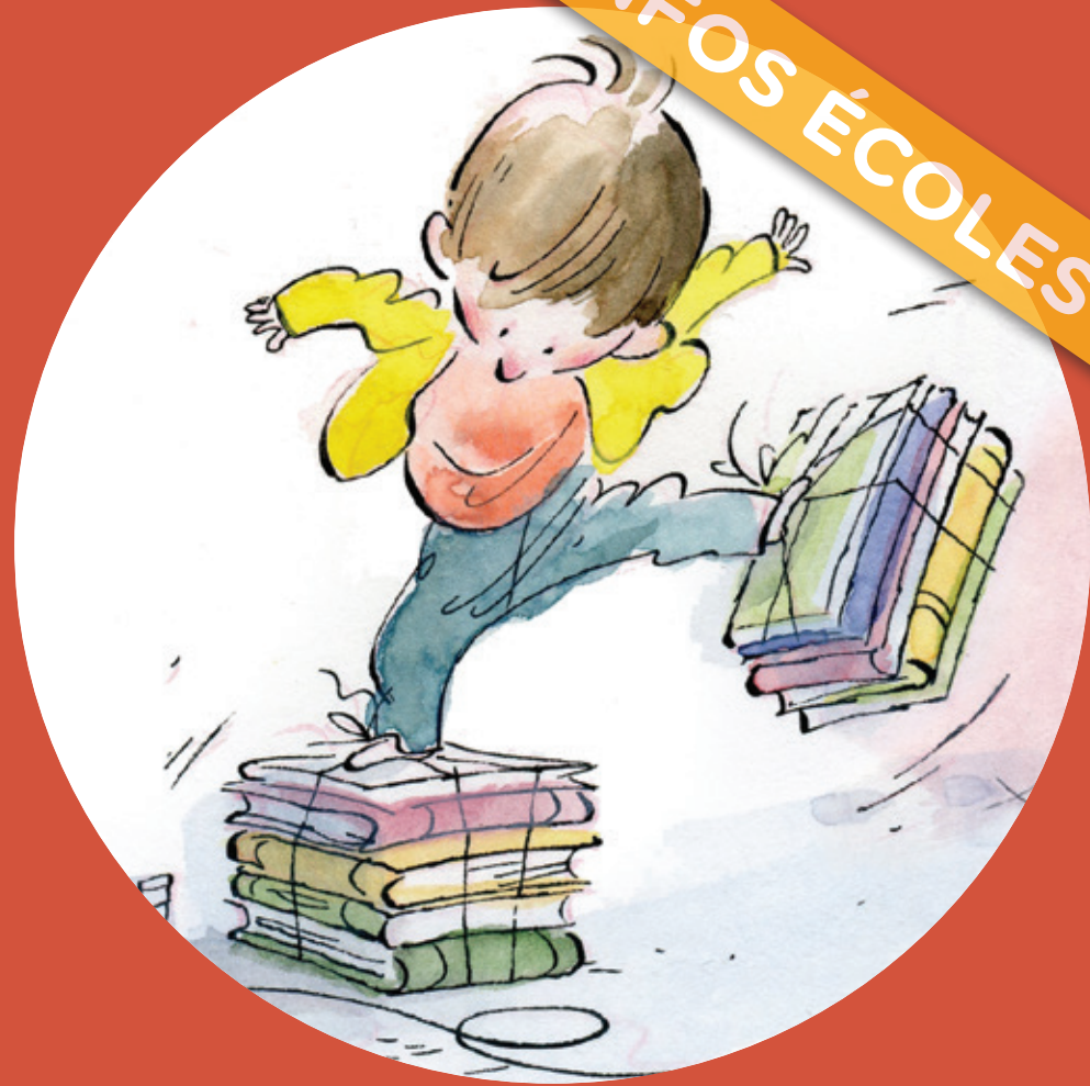
Illustration : Qin Leng