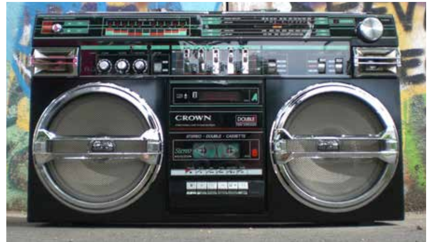
Un poste cassette