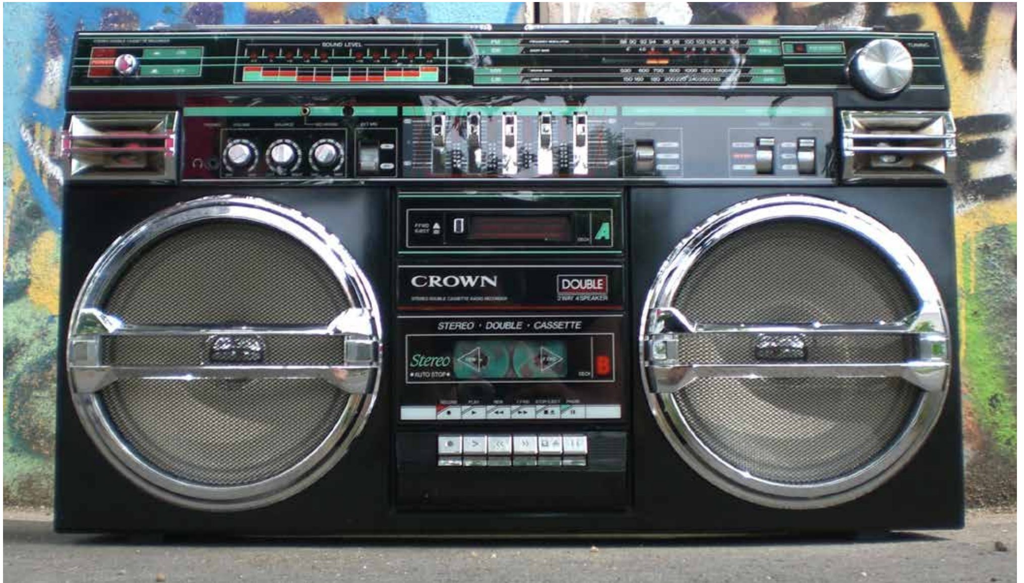
Un poste cassette