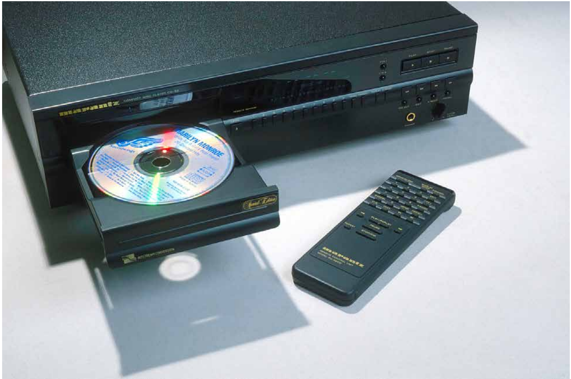
Un lecteur CD