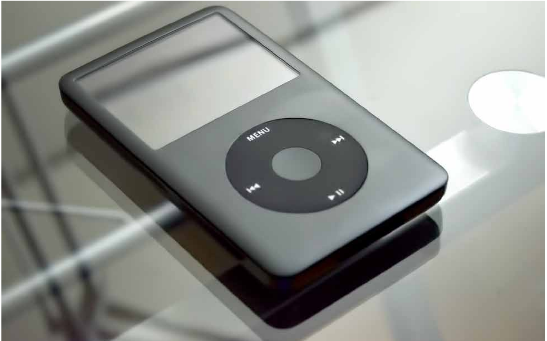
Un lecteur mp3