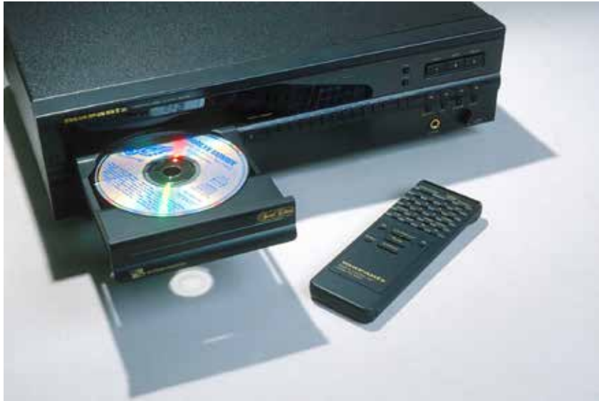
Un lecteur CD