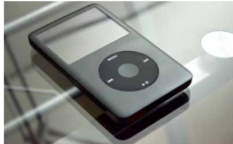
Un lecteur mp3