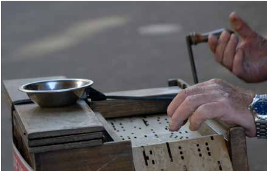
Un orgue de barbarie