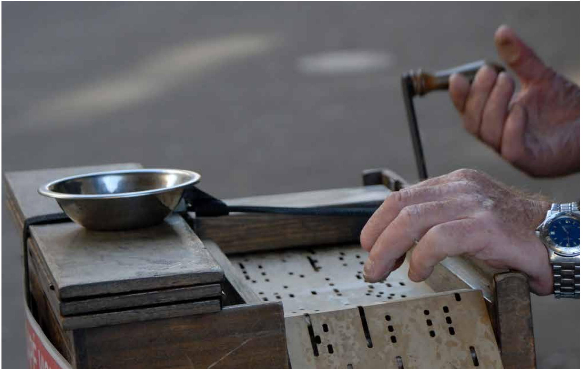
Un orgue de barbarie